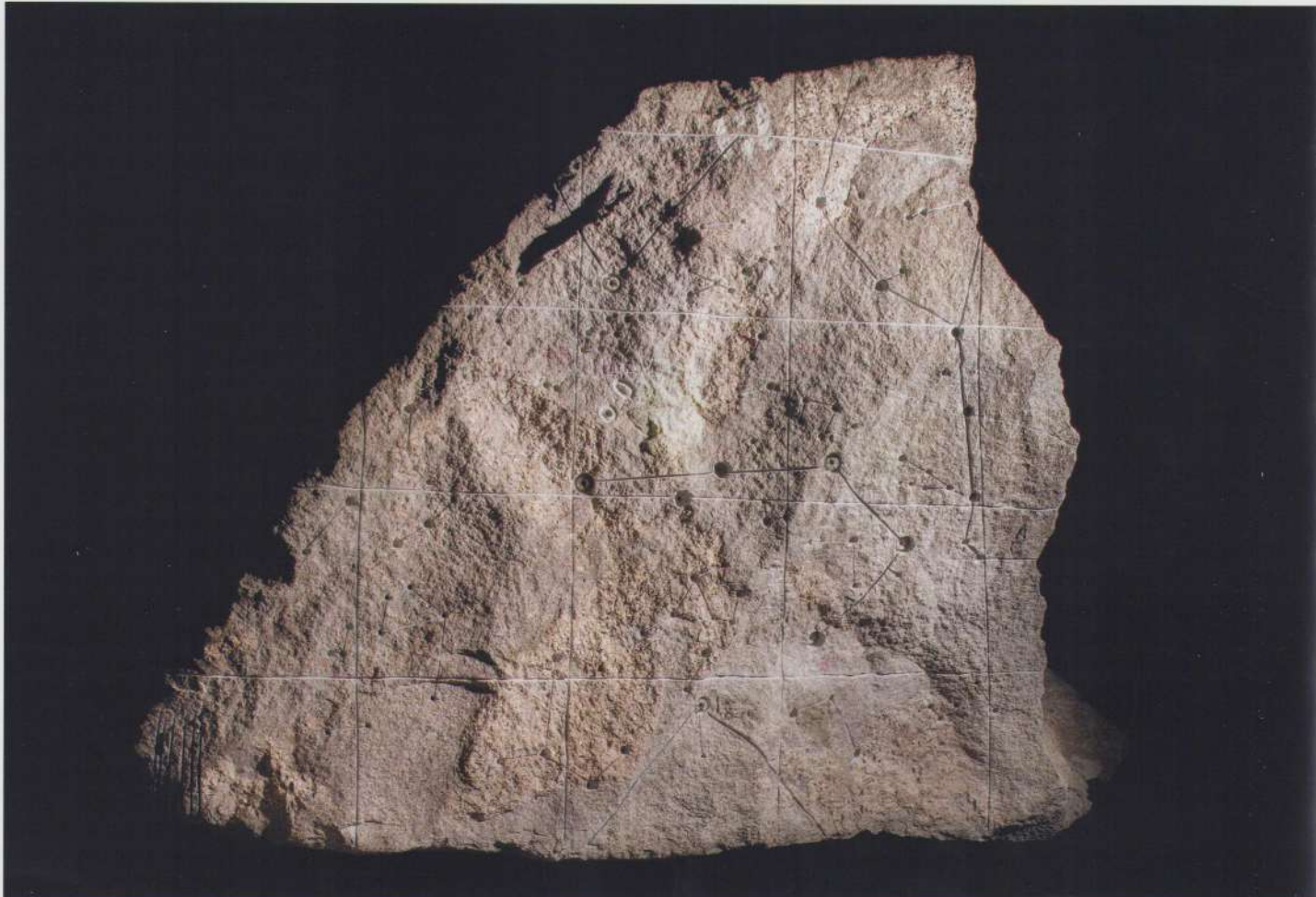
Stoyan Dechev, Sculptor 1 , 2016, granit, 180 x 220 x 340 cm; Foto: courtesy of the artist

Inaugurată în weekendul 19-21 mai, cea de-a cincea ediție a Bienalei de Artă contemporană Art Encounters a adus Timișoarei suflul frenetic al unui festival de film, care te face să alergi pe străzile orașului pentru a te asigura că nu vei pierde nimic. Iar agenda Bienalei vă va umple garantat cel puțin un weekend care poate fi pus la cale și trăit până în 16 iulie.