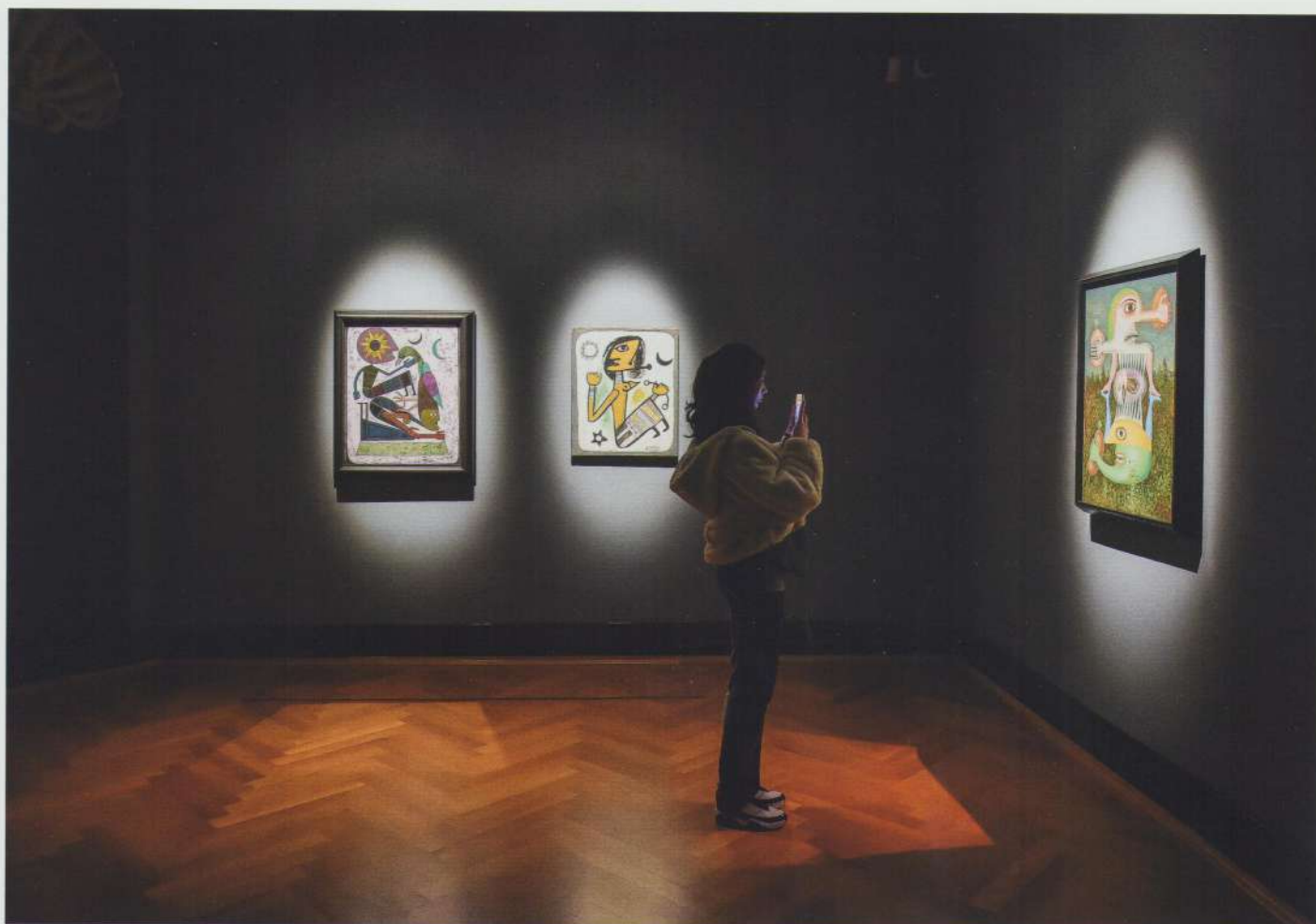
Vedere din expoziție

Între 17 februarie și 28 mai 2023 a avut loc expoziția-manifest Victor Brauner: Invenții și magie , curatoriată de Camille Morando, la Muzeul Național de Artă Timișoara, prima și cea mai importantă retrospectivă a artistului în țara sa de origine. Cu peste 100 de lucrări expuse (picturi, desene, sculpturi, documente și ilustrație de carte, film documentar), dintre care mai bine de 40 de lucrări au fost oferite cu titlu de împrumut special din partea Centrului Pompidou din Paris, alături de lucrări din colecțiile muzeelor Saint Étienne Métropole (MAMC+), Musée Cantini Marseilles și ale altor muzee din România sau colecții private, expoziția a reprezentat un efort colectiv și un omagiu la o sută douăzeci de ani de la nașterea lui Brauner în Regatul României. Scenografia expoziției, realizată de arhitectul Attila Kim, a creat o traiectorie intimă, fluidă, limpede, dublând discursul curatorial prin aceeași claritate și profunzime hermeneutică, de sens.