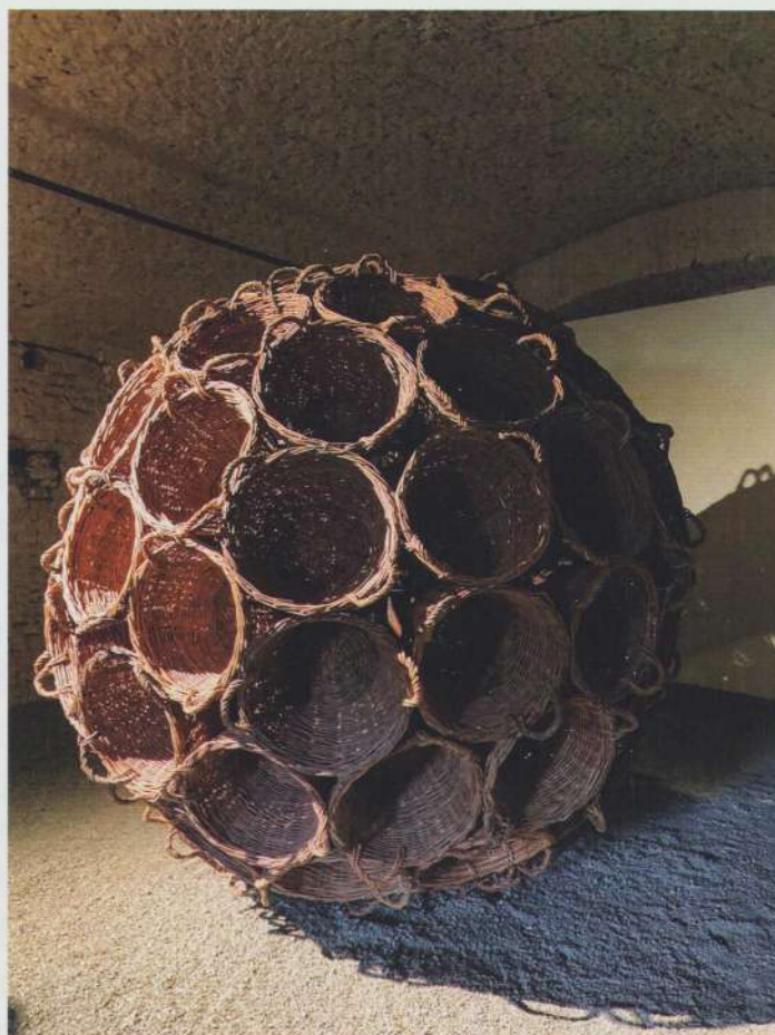
Dan Vezentan, Expoziția după SCULPTURĂ / SCULPTURĂ după , Cazarma U; Foto: Manuela Zîpiși

Bienala Art Encounters conectează din 2015 înapoi tărâmul artiștilor contemporani din toată lumea cu publicul, iar ediția 2023 nu face excepție, propunând întâlnirea cu lucrările a peste 60 de artiști din 21 de țări.