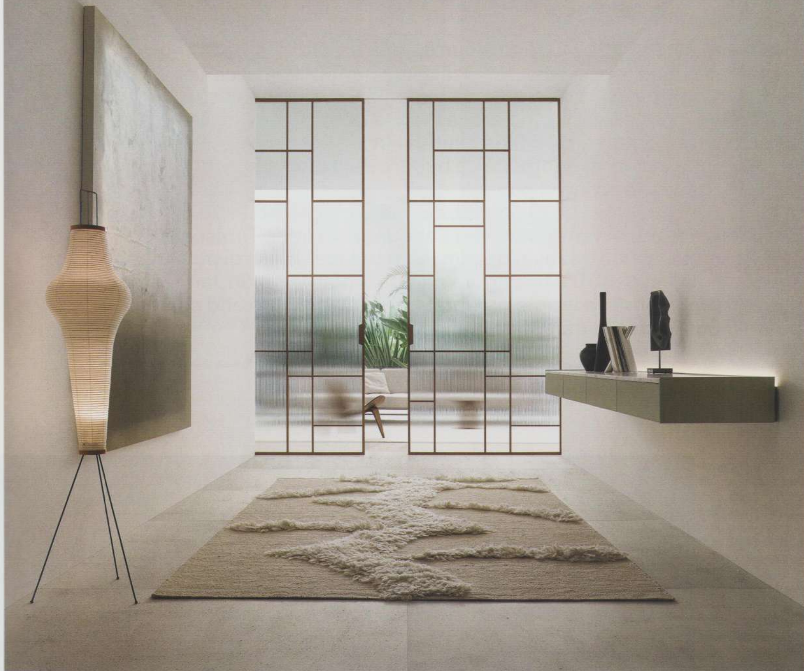
MAXI SLIDING PANELS, SELF BOLD CABINET. DESIGN GIUSEPPE BAVUSO